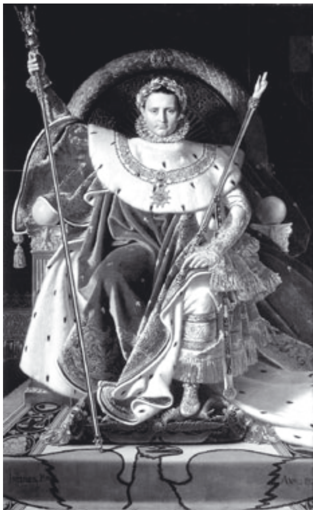
Jean-Auguste-Dominique Ingres, Napoleone sul trono imperiale (1806); Parigi, Musée de l'Armée.

Nell'ambito psicologico, la s. è strettamente imparentata con il narcisismo che deriva da una educazione che non ha conosciuto sufficienti limiti e restrizioni nella fase infantile. Qui il ruolo dei genitori, specie del padre, è importante perché il figlio acquisti una sana stima di sé, costruita non evitando ma affrontando insieme i limiti e gli ostacoli. Se questo non funziona, a causa spesso della latitanza del padre, il bambino 'viziato' cresce con una insicurezza strutturale e cercherà nella vita sempre conferme al suo valore e, non conoscendo i suoi effettivi limiti, non li ammetterà mai e sarà sempre schia-