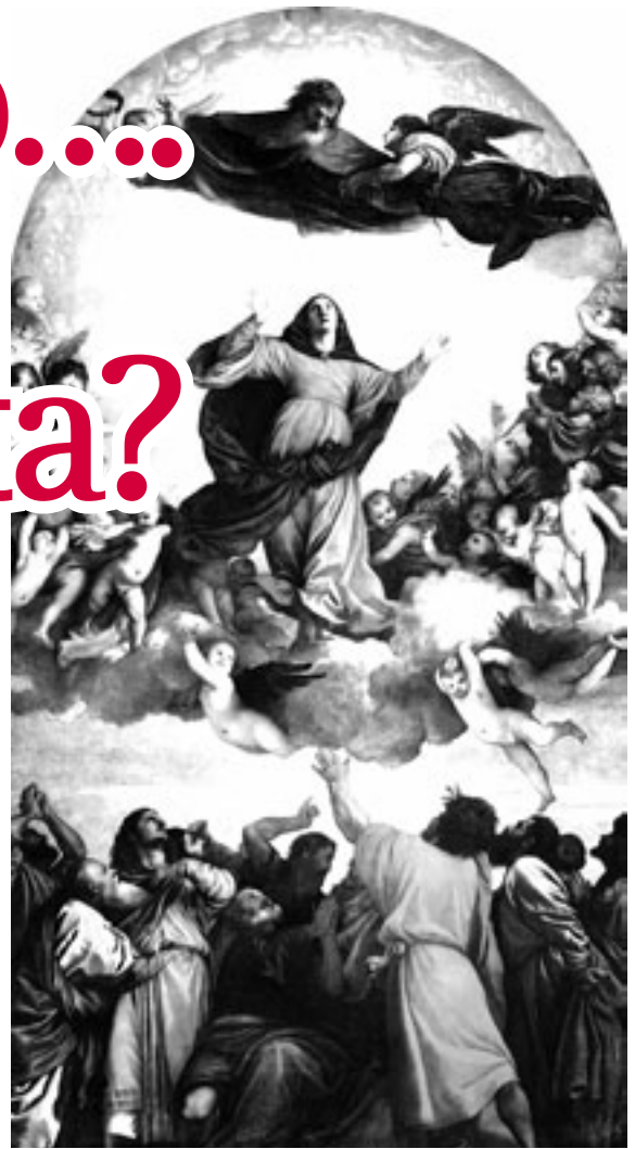
Tiziano, Assunta (1518); pala d'altare; Venezia, Basilica di S. Maria Gloriosa dei Frari

Oggi diciamo buon ferragosto. E diciamo bene. Ma, se il ferragosto è il tempo in cui tutti siamo in ferie, al mare, con un corpo abbronzato, efficiente è pur vero che questo edonismo che il mondo va predicando non ci garantisce una vita piena, che scavalca malattia e morte e ci ricrea vivi e giovani per l'eternità. Nello stesso giorno infatti il mondo cristiano celebra la festa dell'assunzione di Maria.