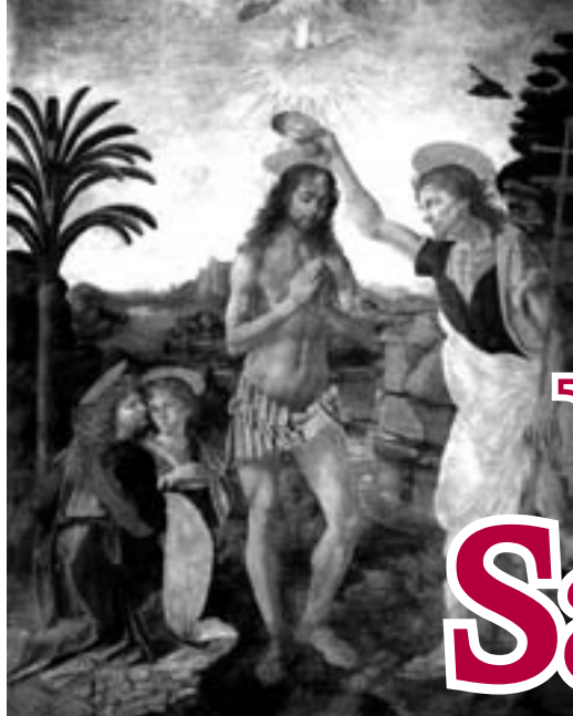
Andrea del Verrocchio e Leonardo da Vinci, Il Battesimo di Cristo ; olio su tela, 1475 ca.; Galleria degli Uffizi, Firenze.