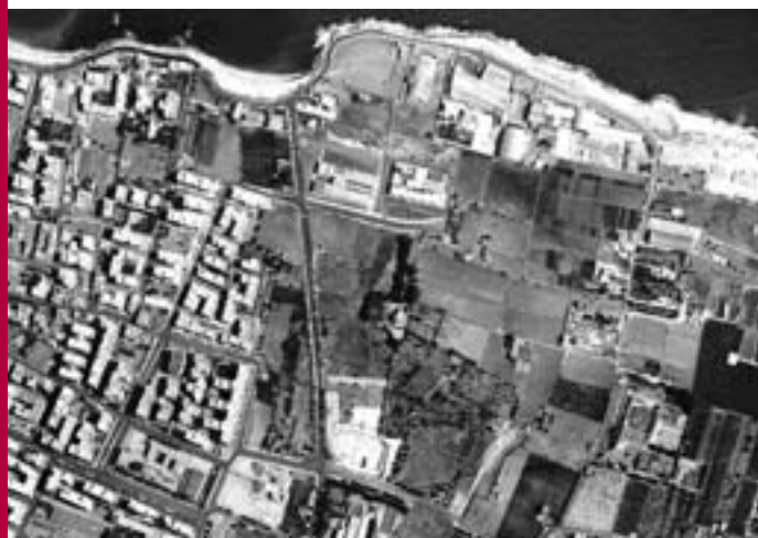
Fotografia aerea, in cui è possibile vedere sulla linea del lungomare la spiaggia del Macello, a sinistra, e quella del Pretore, più grande, centrale; s'intravede anche il vecchio edificio della nostra chiesa.

In questa zona di Bisceglie, si sono fatte nell'ultimo secolo varie e interessanti scoperte archeologiche, quasi totalmente sconosciute e molto diverse fra loro per tema e cronologia, che tuttavia possono dare un'idea di cosa nasconda il territorio o cosa abbia perduto, dato che in gran parte gli stessi flebili segni di un ignoto passato, ancora visibili sino a poco tempo fa, sono stati ormai cancellati e distrutti dall'espansione urbana e dalla cementifi-