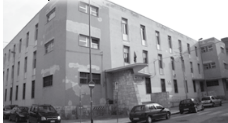
Scuola elementare Prof. V. Caputi, interessata da lavori di ristrutturazione.

Indubbiamente tutti i cittadini deve cooperare, non sono esclusi dall'impegno i commercianti e gli operatori di pubblici esercizi, i quali devono badare a mantenere pulito il nostro quartiere, osservando scrupolosamente il conferimento della spazzatura negli appositi cassonetti, ricordando che la raccolta differenziata è importante per la salute e l'ambiente in cui si vive. Deve inoltre vigilare affinché determinati atti di vandalismo non si verifichino, e nel caso ci fossero, segnalarli prontamente agli organi competenti. Viviamo in una città votata al turismo... facciamo in modo che si parli di Bisceglie non come città della spazzatura, dei topi, dei cassonetti bruciati, del dissesto stradale, ma facciamola conoscere come la 'Rimini del sud' perché il grado di civiltà di una città si misura anche dalla sua pulizia e decoro. »»» Isa Lucivero